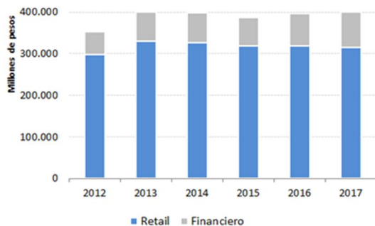
Ilustración 2 Evolución del EBITDA según segmento de negocio (Millones de pesos. 2012-2017)