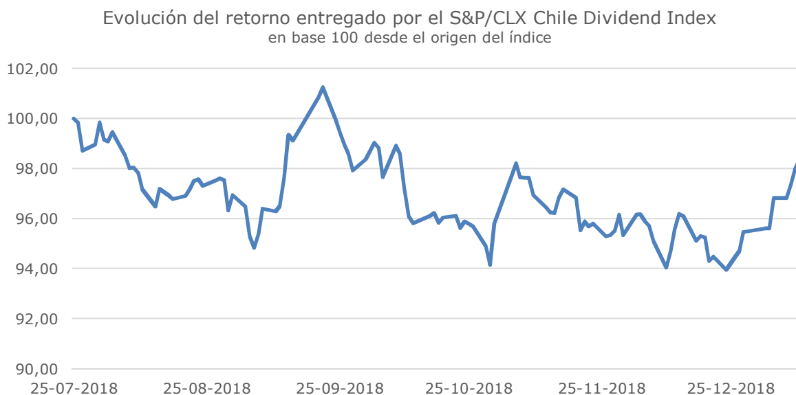
Ilustración 2: Evolución de la rentabilidad del índice

La rentabilidad del fondo, en los días de operación, ha presentado un comportamiento similar al del benchmark . Sin embargo, lo reducido de las observaciones imposibilita extrapolar el comportamiento del fondo en el largo plazo. Por otra parte, la claridad del objetivo del fondo y su política de inversión, junto con la experiencia de la administradora en este tipo de productos, permiten presumir que en el futuro se mantendrá una adecuada relación entre rentabilidad y nivel de riesgo de la cartera del fondo. Con todo, este aspecto debe de ser monitoreado por la clasificadora hasta que se tenga la información histórica suficiente. La Ilustración 2 presenta el comportamiento del índice elaborado por S&P Dow Jones Indices LLC desde el origen.